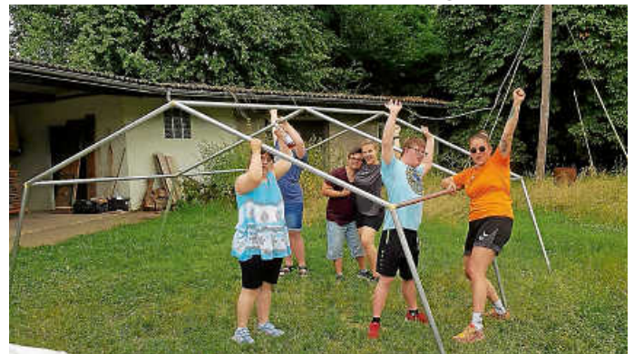
Die „Habichte“ bauen die Zelte auf