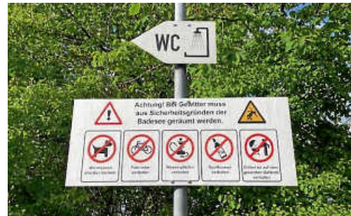
Die Anweisungen auf den Schildern sind dringend zu beachten. Bitte wirken Sie alle mit, dass ein gutes Miteinander gelingt