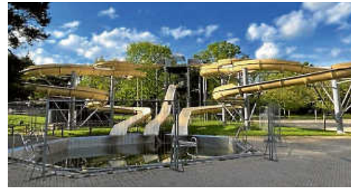
Die Rutsche wird durch einen Zaun abgetrennt und soll entsprechend der personellen und technischen Möglichkeiten geöffnet werden