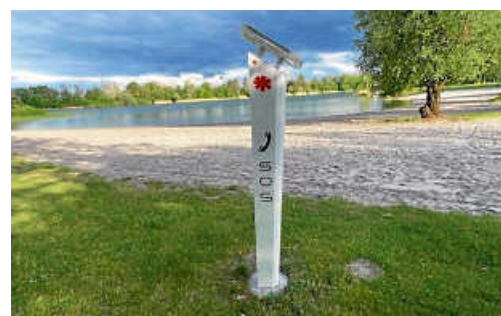
Notrufsäule ist in Betrieb, die Anwesenheit der Wasserrettung wird durch Flaggen angezeigt