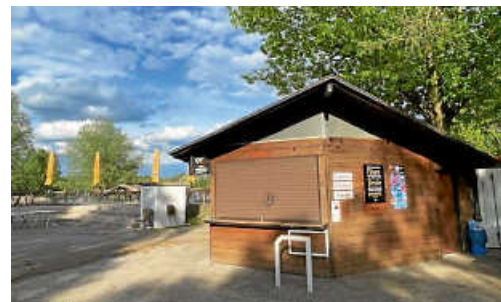
Der Kiosk hat einen neuen Pächter und soll während der Badesaison von 11.30 Uhr bis 19.30 Uhr geöffnet werden. Hierzu gibt es demnächst nähere Infos im MTB