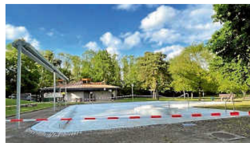
Das Kinderplanschbecken wird auf Elternaufsicht umgestellt, ist aber die gesamte Badesaison geöffnet